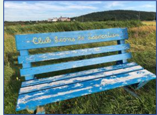
Banc Lions à La Pocatière