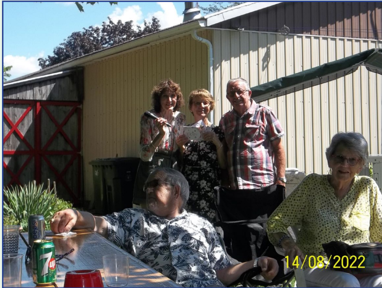
Photo prise lors du pique-nique du président